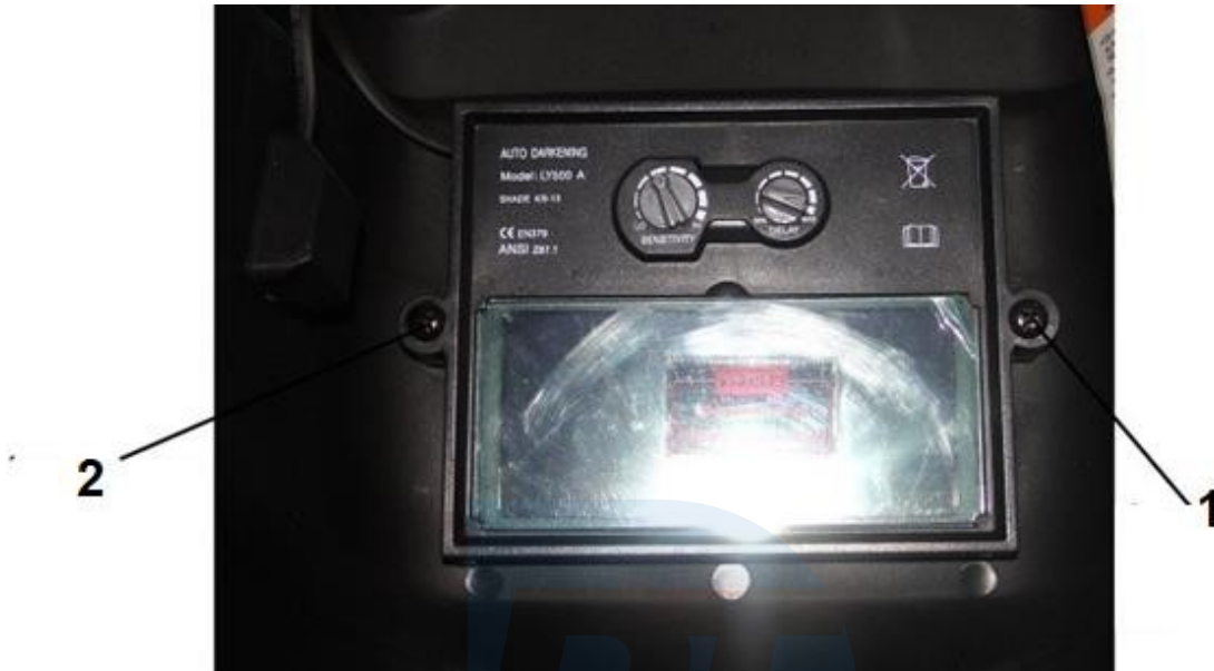
1. Șurub de fixare a cadrului filtrului 2 . Șurub de fixare a cadrului filtrului

Capacul exterior se înlocuiește prin deșurubarea celor 2 șuruburi care fixează cadrul. După ce ați slăbit rama trebuie să ridicați întregul filtru, sub care se află capacul filtrului frontal.